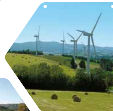
Vallées boisées et prairies aux environs de Saint-Sernin-sur-Rance.