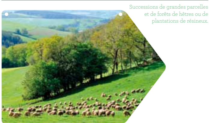
Successions de grandes parcelles et de forêts de hêtres ou de plantations de résineux.

Cette partie ondule entre larges collines et vallons. L'élevage, essentiellement ovin, impose la culture de grandes prairies fourragères. Le bocage* y est encore présent malgré des suppressions de haies (cf. fiche thématique dédiée à la haie). Le Viaur prend sa source au pied du Puech du Pal, près de La Clau. Les dernières zones humides et les tourbières sont à préserver pour conserver une mosaïque de milieux, riches en biodiversité (le verso de ce dossier traite de cette spécificité).