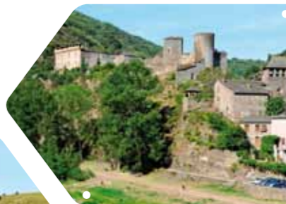
Landes en crête.

► Auteur : Parc naturel régional des Grands Causses