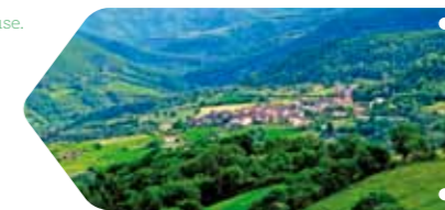
Marzials, village occupant un replat dans la Vallée de la Muse.

Vallée encaissée dont les versants les plus pentus sont couverts de châtaigneraies et de terrasses autrefois cultivées, elle est ponctuée de villages (Saint-Léons, Saint-Laurent-du-Lézou, Saint-Beauzély, Castelnaud-Pégayrols, Montjaux) installés sur des replats bien exposés, marqués par un parcellaire bocager* à base de frènes.